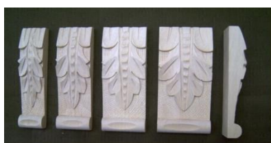
101. List klasik