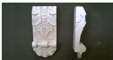
105. List s patkou nízký