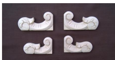
12. Vlnka (levá, pravá)