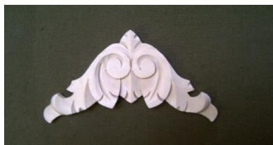
14. Roh uzavřený