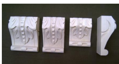
107. List velký

š 80 x v 190 x hl 60 1.037,-/ks š 140 x v 340 x hl 60 na poptávku