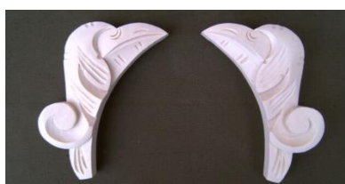
19. Ptáci (levá, pravá)