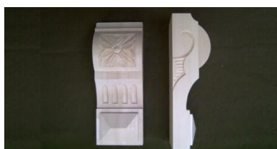
111. Růže gigant