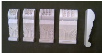
115. List spodní

š 35, 40, 45 x v 120 x hl 20 š 50, 60 x v 120 x hl 20