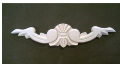
13. Horizontální řezba