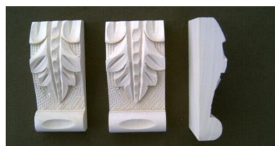
119. List krátký