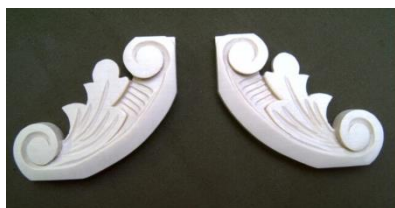
16. Kolébka (levá, pravá)