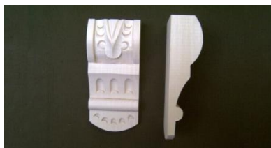
113. Indonézáská řezba