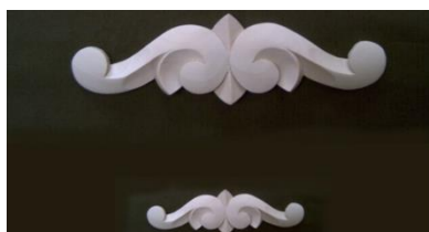
109. Horní řezba nižší

š 385 x v 146 x hl 12 1.037,-/ks š 190 x v 78 x hl 8 392,-/ks