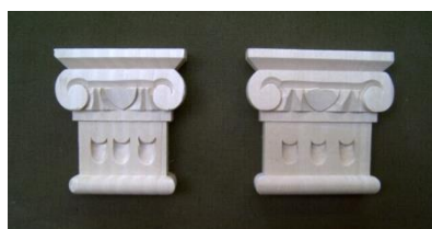
110. Antický sloupek

š 400 x v 121 x hl 12 987,-/ks š 205 x v 60 x hl 8 346,-/ks