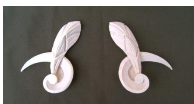
21. Ryby (levá, pravá)