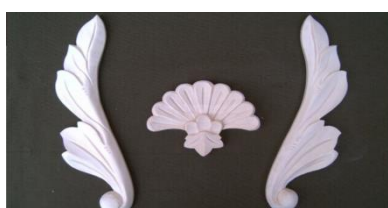
23. Křídla (levá, pravá)