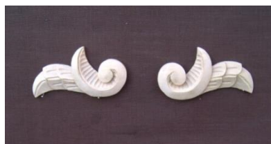
9. Křídlo (levé, pravé)