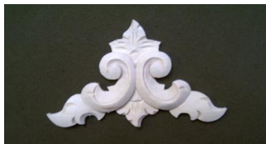
15. Roh otevřený