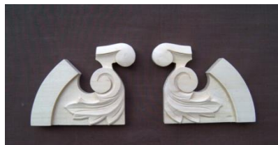
1. Antik (levá, pravá)