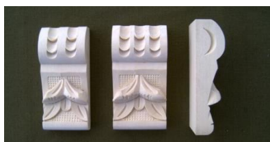
118. Švestka krátká