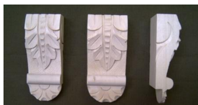
104. List s patkou vysoký