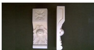
112. Růže atyp