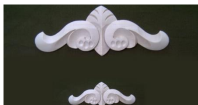
108. Horní řezba vyšší

š 385 x v 146 x hl 12 1.037,-/ks š 190 x v 78 x hl 8 392,-/ks