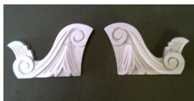
4. Boky (levý, pravý)