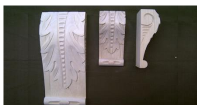
106. List velký

š 80 x v 190 x hl 60 1.037,-/ks š 140 x v 340 x hl 60 na poptávku