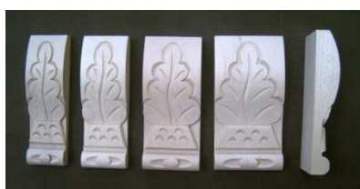
117. List dubový